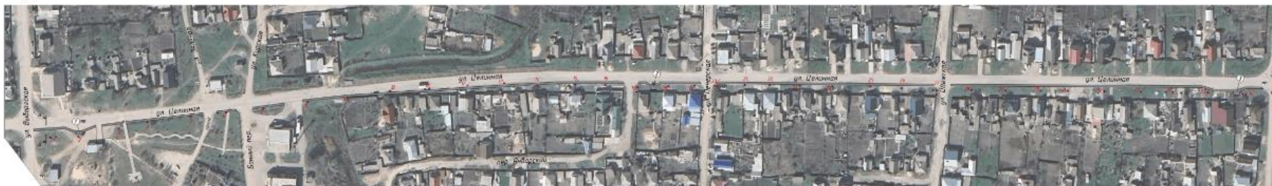
ФОТО ТЕРРИТОРИИ БЛАГОУСТРОЙСТВА (существующее положение)